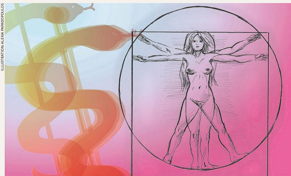
ILLUSTRATION: ALEXIA PARADOPOLUS

«Mein Hausarzt meinte, Fibromyalgie sei eine Verlegenheitsdiagnose. Ich solle mich eben mit meinem Zustand abfinden.»